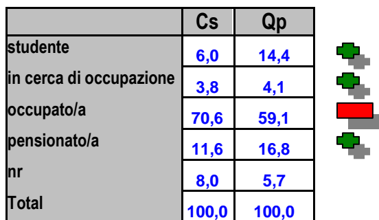
Situazione lavorativa [tav. 4]

La tav. 4 conferma il momento difficile che si sta attraversando. La diminuzione di presenze di chi è occupato rispetto a chi non lo è (-11,5), con rilevamenti collocati a pochi mesi di distanza, ridisegna la situazione del territorio. Ma segnala altresì una maggiore attenzione di chi ancora non si è inserito nel mondo del lavoro o di chi ne è già uscito. La presenza di studenti è ben più che raddoppiata e i pensionati sono cresciuti di un terzo. Si può ritenere che la coscienza dell'importanza di tenere sotto controllo la salute orale, se solo le condizioni lo permettono, sia un importante dato su cui impostare lo sviluppo dell'azienda. Gli studenti , perché le famiglie, che li sostengono economicamente, hanno preso coscienza dell'importanza del controllo sistematico del cavo orale, dovere di tutta la vita che si apprende fin da piccoli. Magari gli adulti diradano le cure per se stessi, ma intensificano l'attenzione sui figli. I pensionati , seppure talvolta in difficoltà, modificano la scala della risposta ai bisogni, andando a collocare la cura del cavo orale in un'area sempre più elevata e spostandone altre più in basso, qualora non fosse loro possibile rispondere contemporaneamente a tutte.